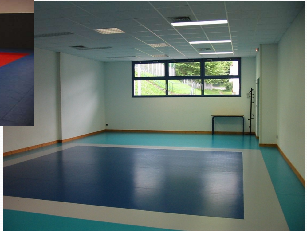
La Salle Multisports