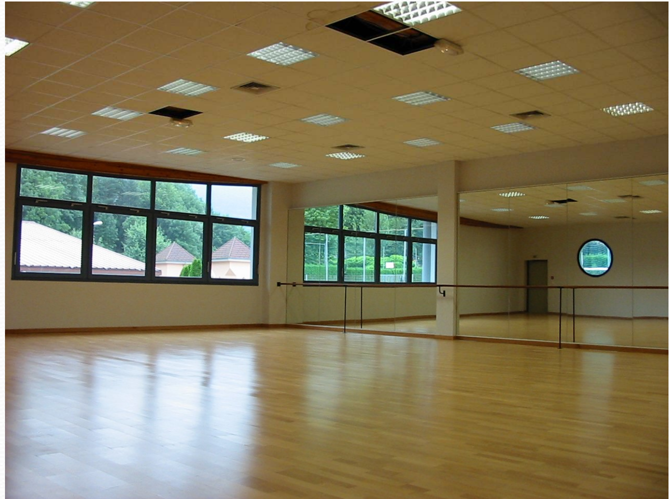
La Salle de Danse