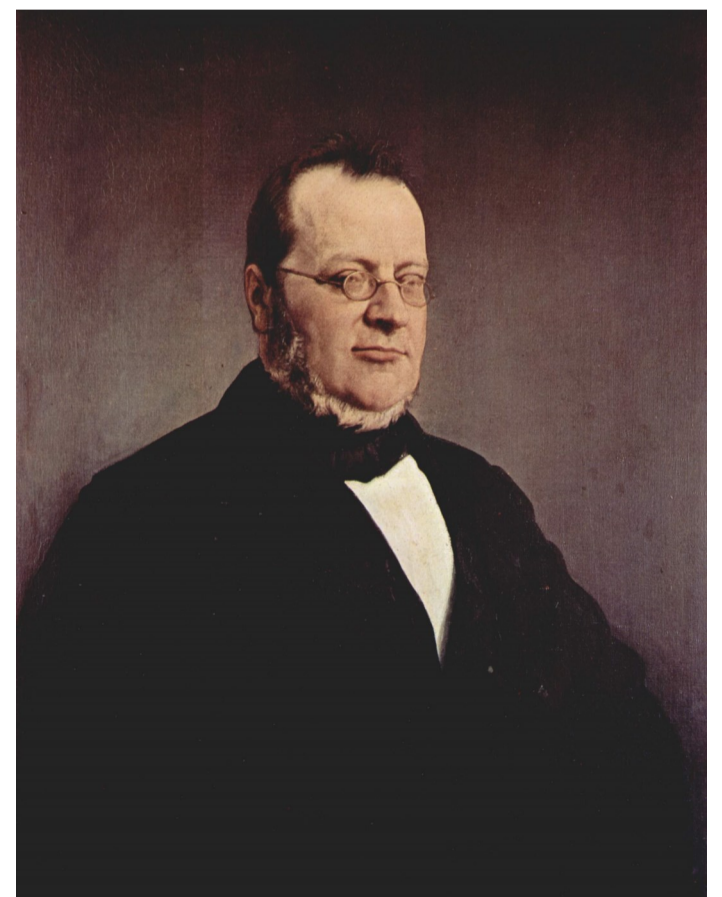
Camillo Benso, comte de Cavour